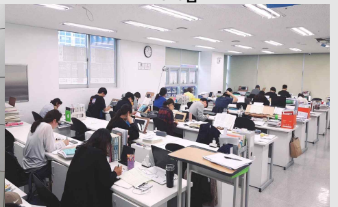
★매일오전 실전같은 모의고사 실시★